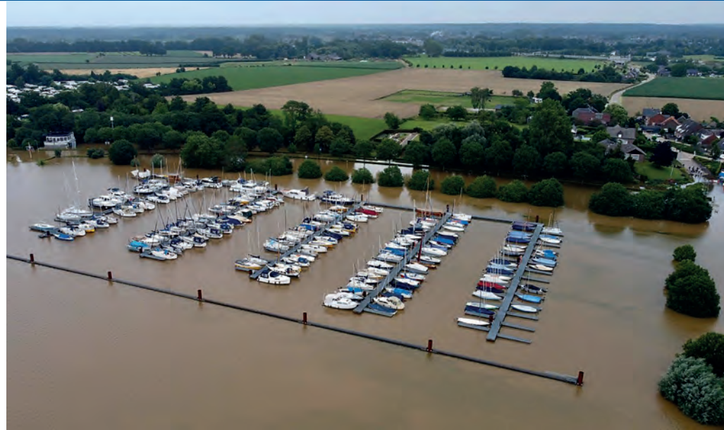
Sommerhochwasser Juli 2021

Die Webseite www.maasparcasselt.nl zeigt mit 280 Liegeplätze für Motorboote mit einer Länge von 15 bis 30 Metern eine unerwünschte Entwicklung. Die Bestimmung lässt zwar einen Hafen zu, doch diese stammt aus 2007 doch es fehlen die erforderlichen Änderungen und eine räumliche Begründung. Der Plan passt nicht zum offiziellen Asselter Status eines „denkmalgeschützten