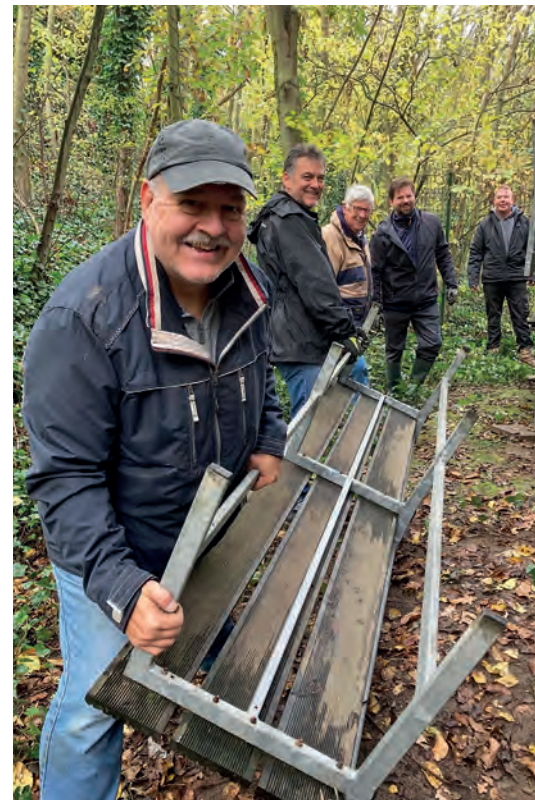
Gemeinsam anpacken: nicht nur beim Aufräumtag

Ich wünsche Ihnen und Ihren Familien ein schönes Weihnachtsfest und ein gesundes und erfolgreiches 2022.