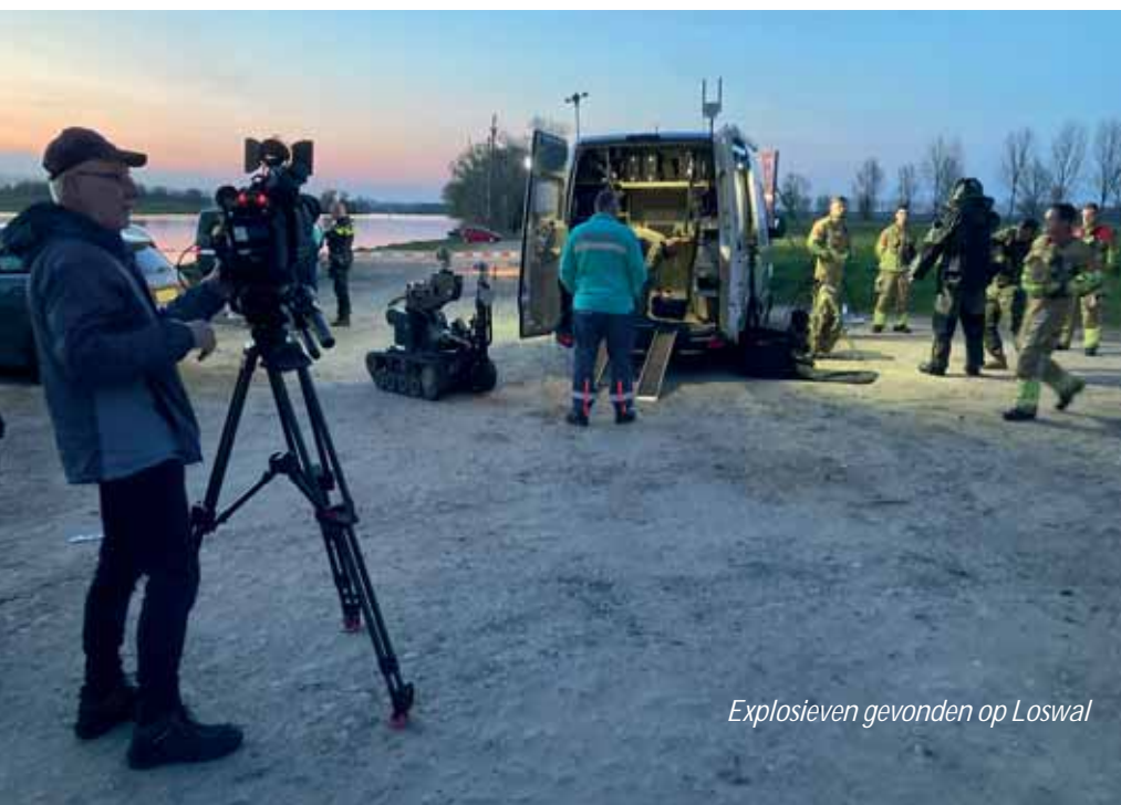
Explosieven gevonden op Loswal

In het nieuwe jaar kan op verzoek van vele leden niet alleen met de bekende consumptiebonnen worden betaald, maar ook "contactloos". Laten wij het clubhuis optimaal en gezellig benutten! De zeilwedstrijden blijven voor velen een gelegenheid waarbij de deelnemers met