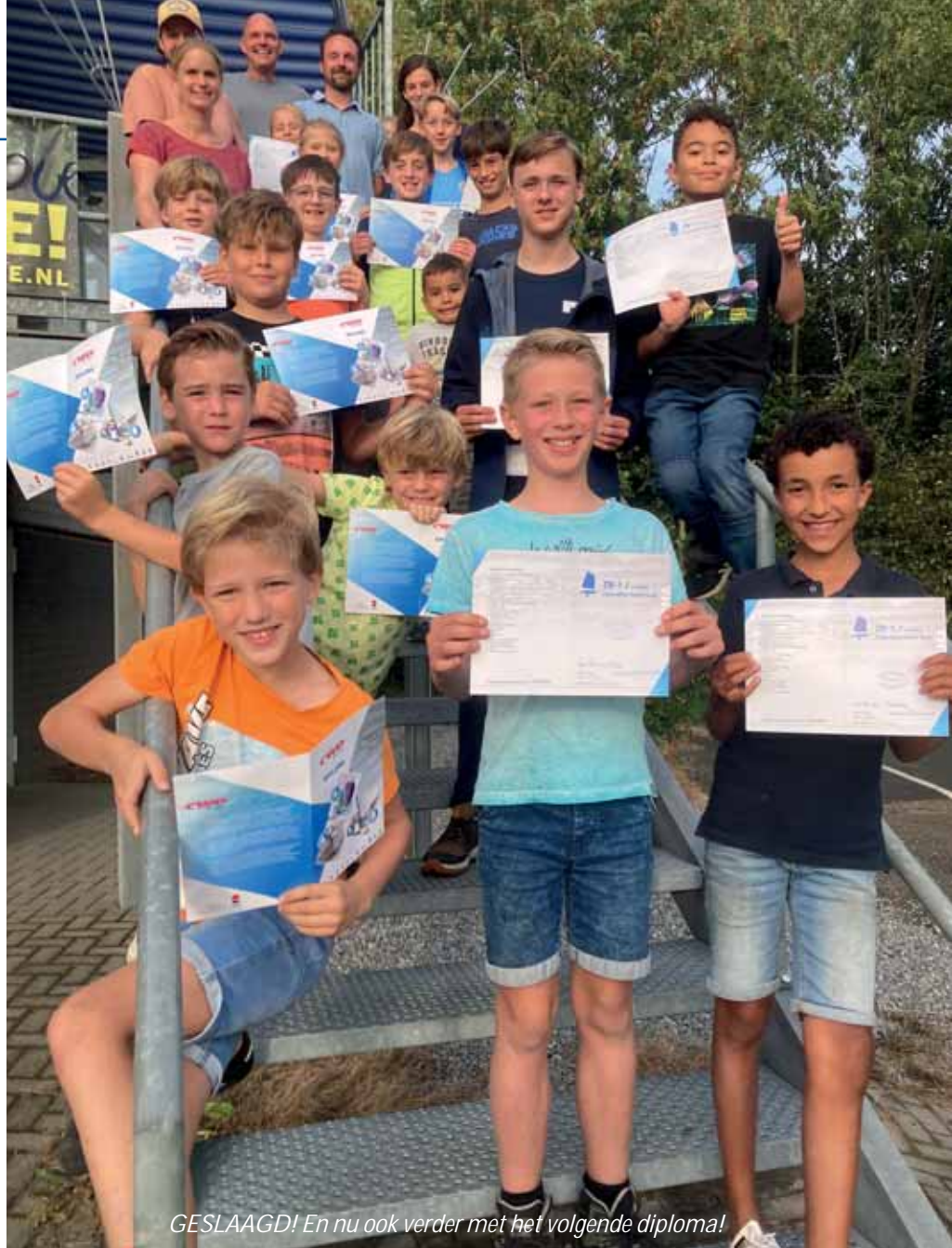
GESLAAGD! En nu ook verder met het volgende diploma!

Het grote aantal van 25 cursisten zorgde ervoor dat deze in drie verschillende groepen verdeeld moesten worden. Dat betekende extra werk en inzet voor onze instructeurs, maar met de fijne hulp van diverse actieve ouders kijkt Ascloa tevreden terug op een mooi seizoen. Met een door de ouders ondersteunde barbecue en spellenmiddag in Neer en een feestelijke diploma-uitreiking in het clubhuis, kijkt onze jeugd al uit naar 2024. In dat jaar worden twee nieuwe 2-mans jeugdboten aangeschaft, zodat de gevorderde cursisten ook in deze klasse hun opleiding kunnen voltooien. Tijdig aanmelden is gewenst, want de groepen zijn al bijna vol!