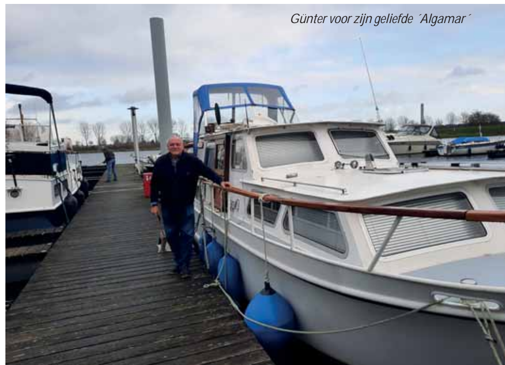
Günter voor zijn geliefde ‘Algamar’