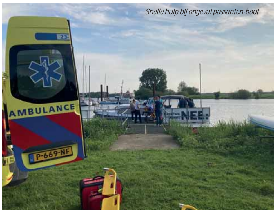
Snelle hulp bij ongeval passanten-boot