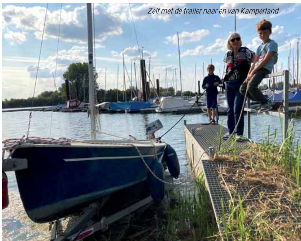
Zelf met de trailer naar en van Kamperland